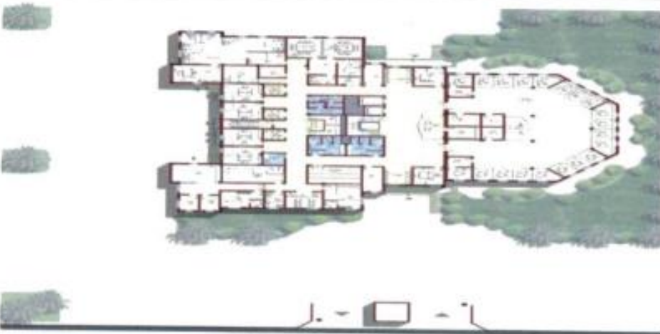
مسقط أفقي للدور الأول