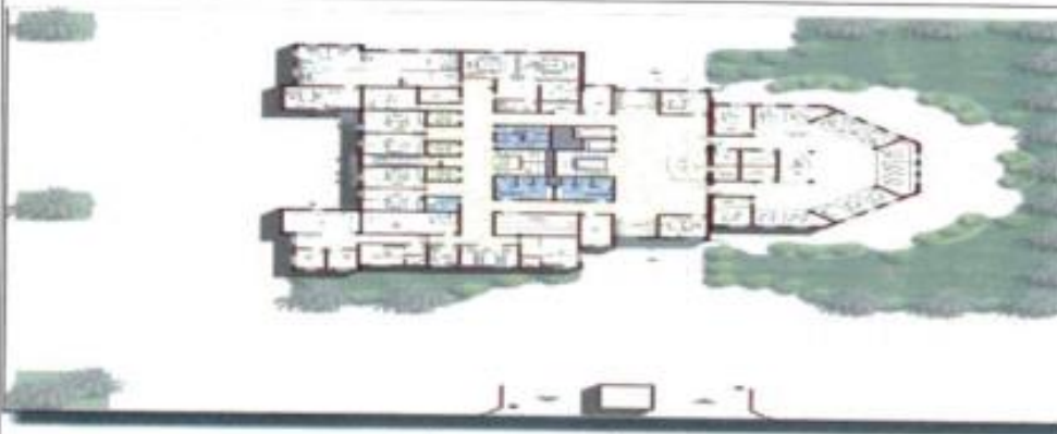
مسقط أفقي للدور الأول