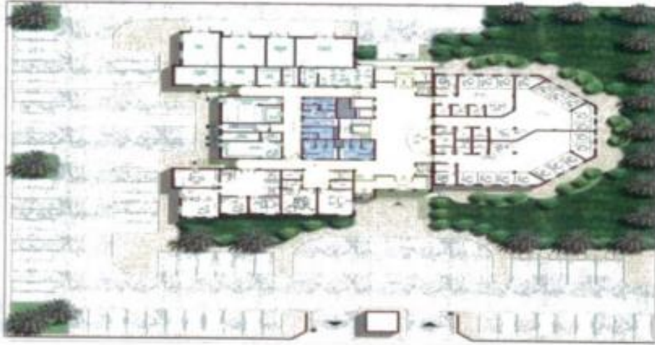
مسقط أفقي للدور الأرضي