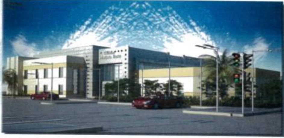
مخطط مركز غسيل كلوي فئة (٢٠) سرير - لقطه منظوريه