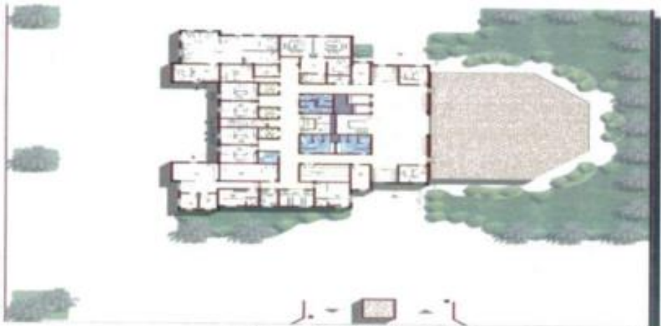
مسقط أفقي للدور الأول