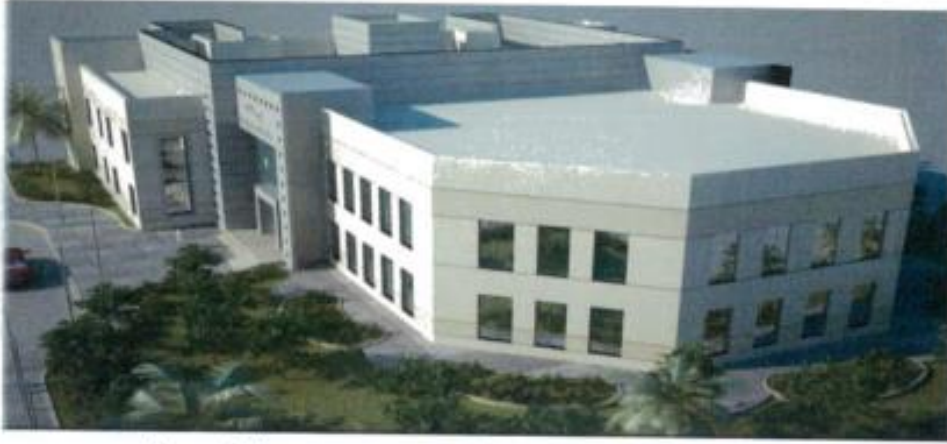
مخطط مركز غسيل كلوي سعة (٤٠) كرسي - لقطه منظوريه