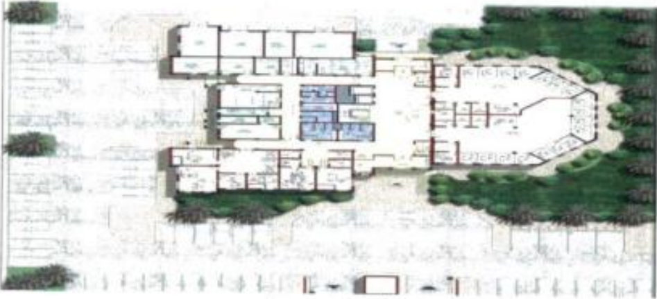
مسقط أفقي للدور الأرضي