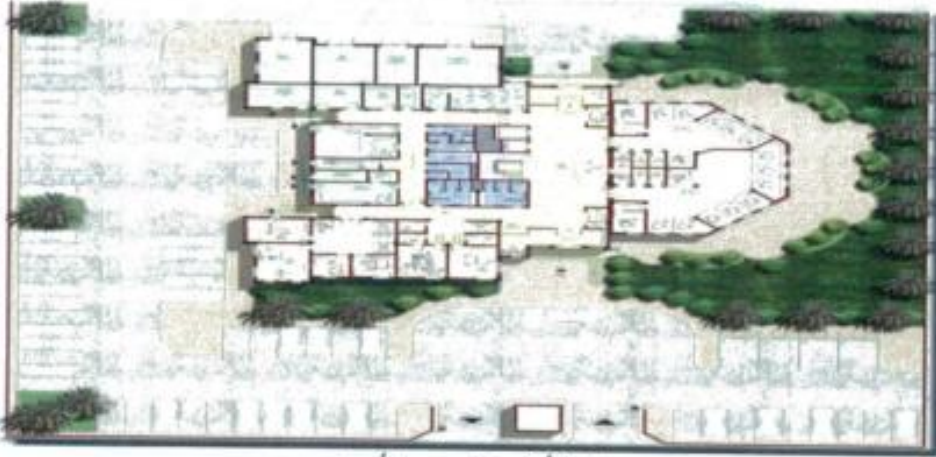
مسقط أفقي للدور الأرضي