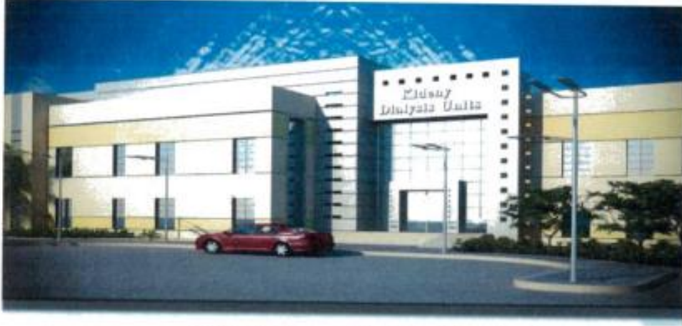
مخطط مركز غسيل كلوي سعة (٣٠) كرسي